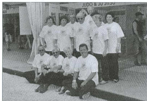
■ Les seniors à l'artéplage d'Yverdon-les-Bains à Expo 02.