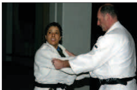
■ 6h30, approche de la technique.