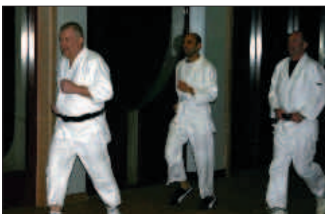
■ 6h15, échauffement à l'extérieur.