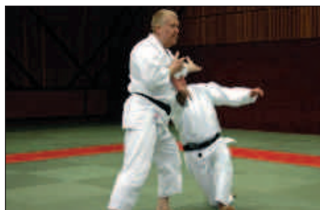
■ 7h00, mise en application au dôjô.

d'entraînement (dôjô) de l'école Bellavista II. Chacun était libre d'y participer car c'est un engagement personnel et individuel!